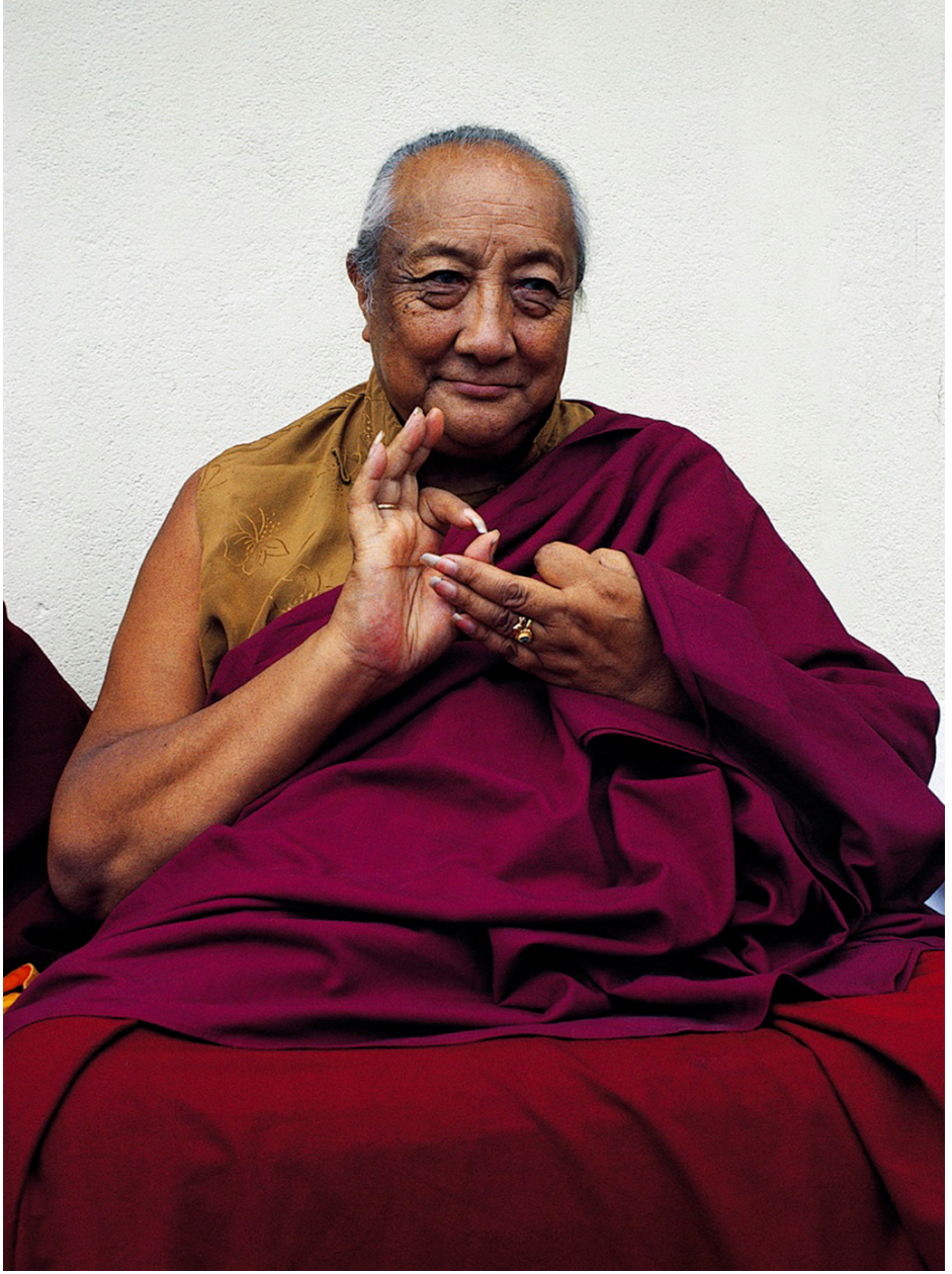
DILGO KHYENTSE RINPOCHE