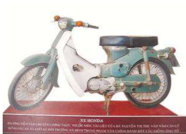
Xe Honda trưng bày tại nhà Truyền thống Bưng Sáu Xã